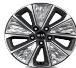
Cerchi in Lega da 17" 215/55 R17