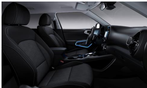
Sedili in tessuto di serie