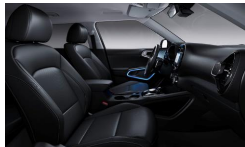
Sedili in pelle (SUV Pack)